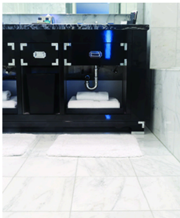
Diseñado especialmente para porcelanatos