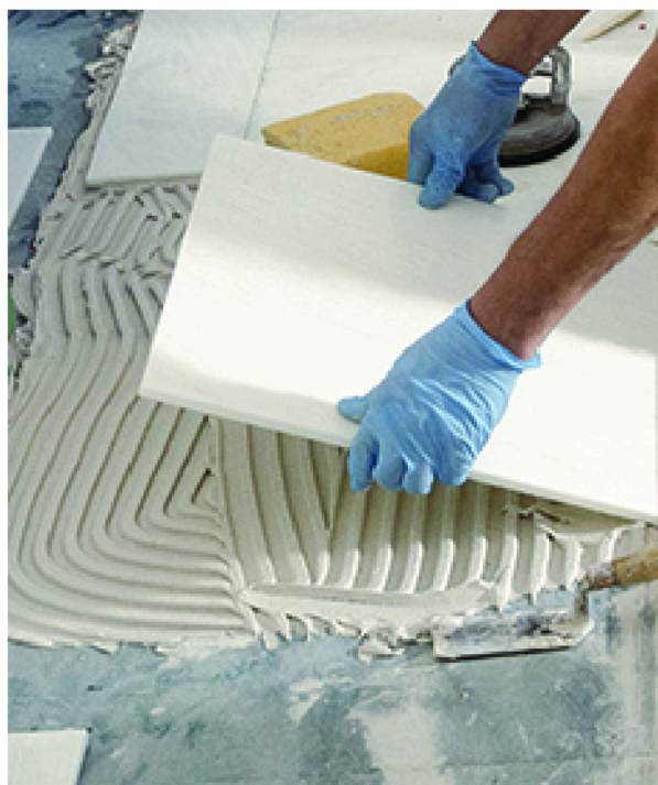
Aplicación del adhesivo